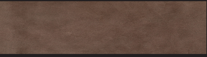
Cioccolato 0,9/1,0 1,2/1,4