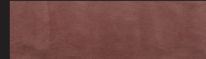
Brown rose 0,9/1,0