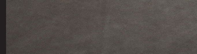
Griggio 0,9/1,0 1,2/1,4