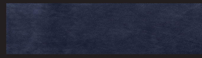
Marino 0,9/1,0 1,2/1,4