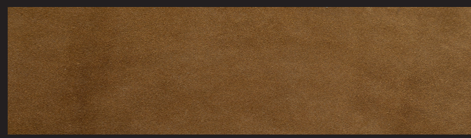
Cognac 0,9/1,0 1,2/1,4