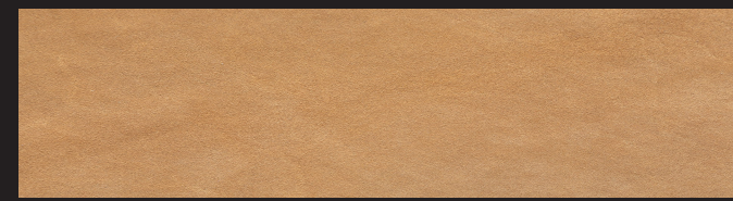
Camel 0,9/1,0 1,2/1,4