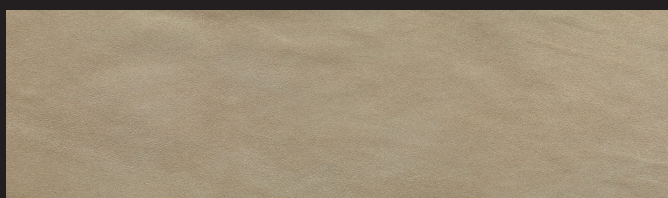
Pietra 0,9/1,0 1,2/1,4