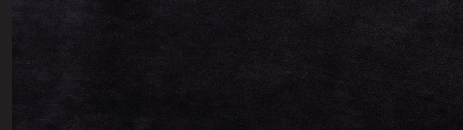
Negro 0,9/1,0 1,2/1,4