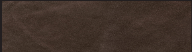
Ebano 0,9/1,0 1,2/1,4