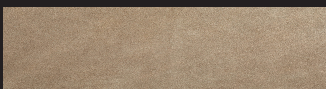
Taupe 0,9/1,0 1,2/1,4