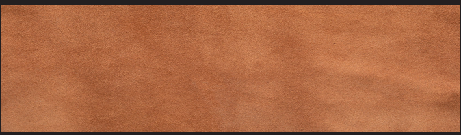
Cuio 0,9/1,0 1,2/1,4