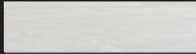
Bianco 0,9/1,0 1,2/1,4