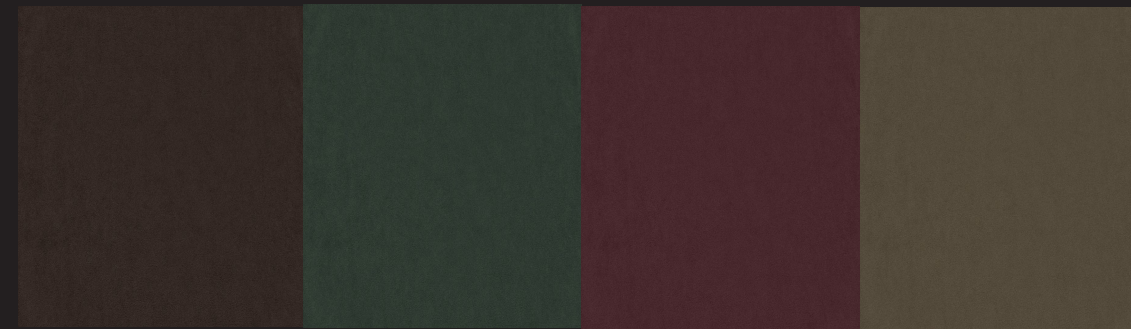
Testa di Moro