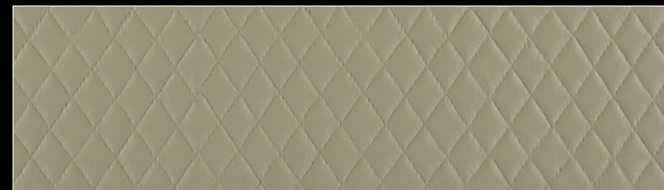
MÓNACO ROMO 001 / 003 / 007 / 010 / 011 / 015 / 020 030 / 036 / 040 / 044 / 046