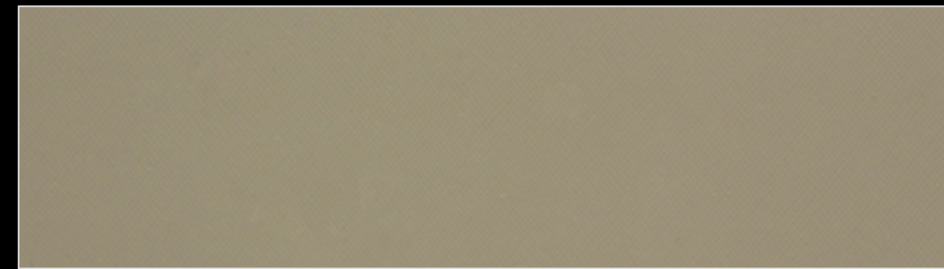
MÓNACO MINI 002 / 005 / 011 / 012 / 043 / 047 / 048 / 049